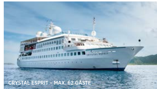
CRYSTAL ESPRIT - MAX. 62 GÄSTE