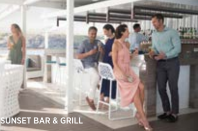
SUNSET BAR & GRILL

BRITISCHE JUNGFERNINSELN - KLEINE ANTILLEN