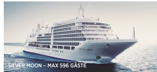
SILVER MOON - MAX 596 GÄSTE