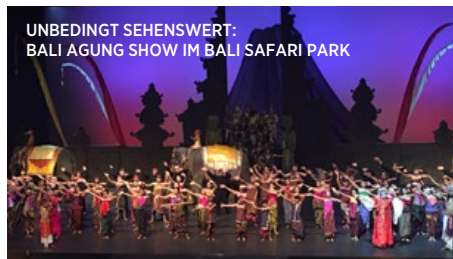
UNBEDINGT SEHENSWERT: BALI AGUNG SHOW IM BALI SAFARI PARK