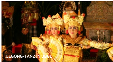
LEGONG-TANZ IN UBUD