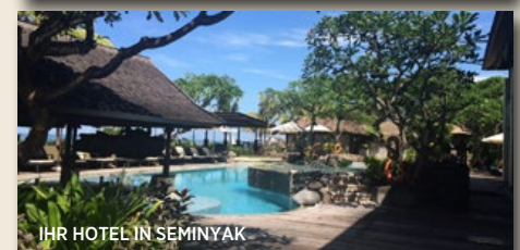
IHR HOTEL IN SEMINYAK

INDIVIDUELLE OFFERTEN ARBEITEN WIR IHNEN MIT UNSEREN BALI-ERFAHRUNGEN GERNE AUS