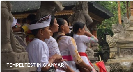
TEMPELFEST IN GIANYAR