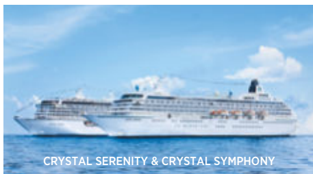
CRYSTAL SERENITY & CRYSTAL SYMPHONY

EXKLUSIVE REISEN & KREUZFAHRTEN MIT DEN BESTEN CRUISELINES