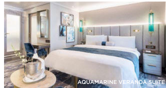
AQUAMARINE VERANDA SUITE