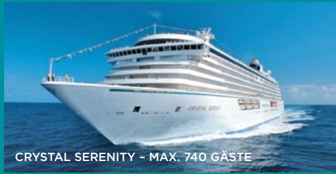
CRYSTAL SERENITY - MAX. 740 GÄSTE