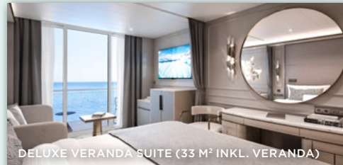
DELUXE VERANDA SUITE (33 M² INKL. VERANDA)

✈ ABFLUG AB MIAMI JEWEILS EIN TAG FRÜHER