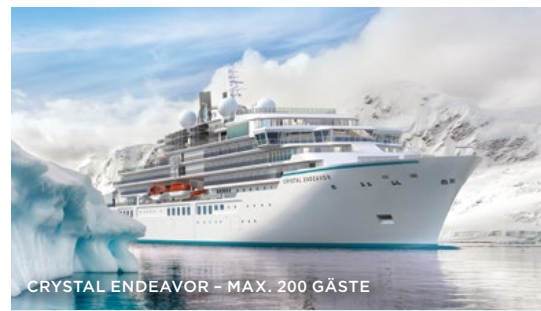
CRYSTAL ENDEAVOR - MAX. 200 GÄSTE

VERANSTALTER & CRYSTAL CRUISES VERTRETUNG Aviation & Tourism International GmbH Wasserloser Straße 3a · 63755 Alzenau Tel. 06023/917150 · Fax 06023/917169 info@atiworld.de · www.atiworld.de