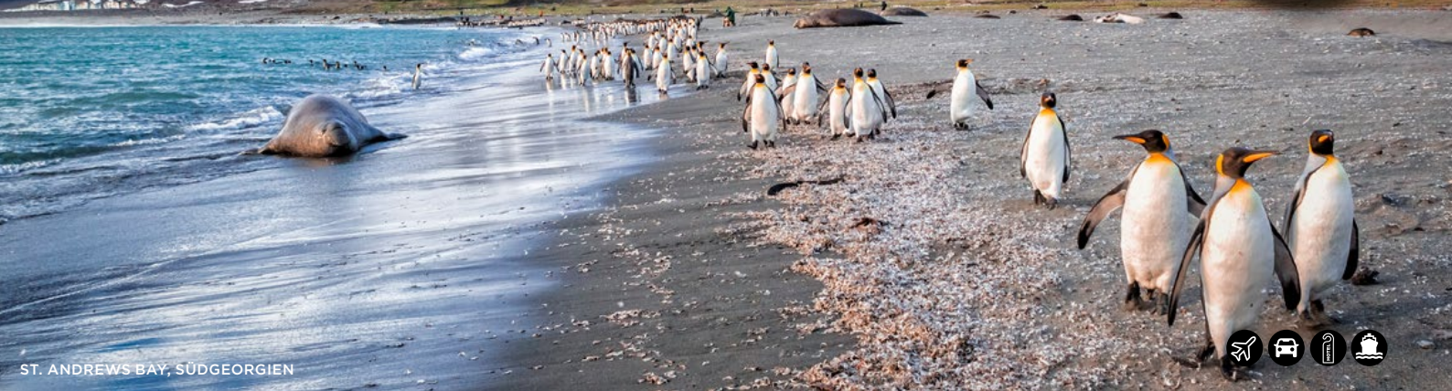
ST. ANDREWS BAY, SÜDGEORGIEN

INKLUSIVE FLÜGE AB/BIS MIAMI, HOTELS & 1000 USD BORDGUTHABEN*