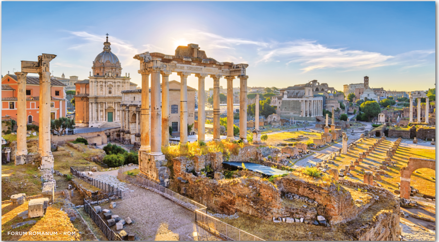
FORUM ROMANUM – ROM