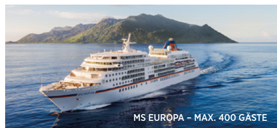
MS EUROPA - MAX. 400 GÄSTE