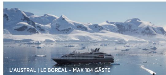
L'AUSTRAL | LE BORÉAL - MAX 184 GÄSTE

Eisbären, Polarfüchse, Spitzbergen-Rentiere, Walrosse, Bartrobben, Seehunde, Eissturmvögel, arktische Seeschwalben, Dreizehenmöwen, Eiderenten, Lummen, Blauwale, Zwergwale, Schwertwale.