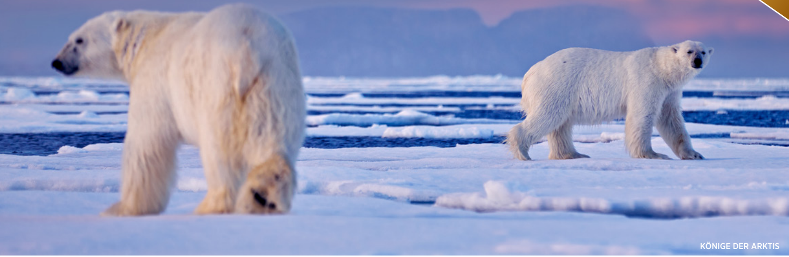
KÖNIGE DER ARKTIS