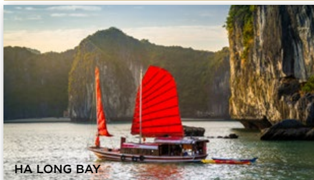
HA LONG BAY