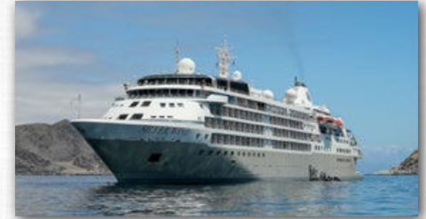
SILVER WIND | 274 GÄSTE