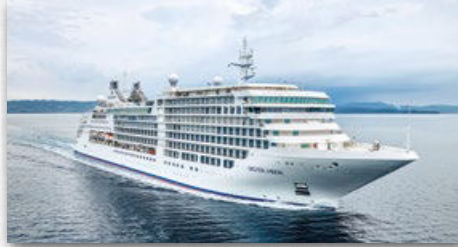
SILVER MOON | 596 GÄSTE