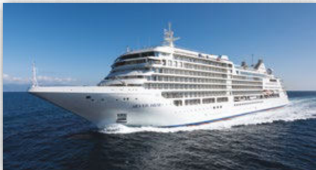
SILVER MUSE | 596 GÄSTE