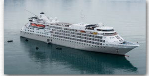
SILVER CLOUD | 254/240 GÄSTE