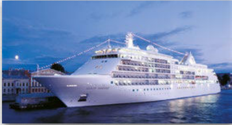
SILVER WHISPER | 388 GÄSTE