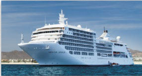
SILVER SPIRIT | 608 GÄSTE