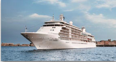
SILVER SHADOW | 388 GÄSTE

Eine aufmerksame Crew setzt sich unermüdlich dafür ein alle Wünsche zu erfüllen.