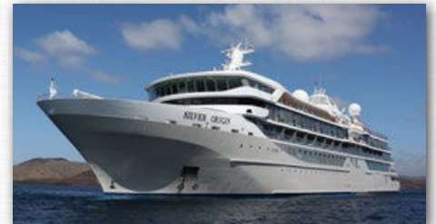
SILVER ORIGIN | 100 GÄSTE

Die allgemeinen Reise- und Rücktrittsbedingungen von Silversea Cruises liegen zugrunde und werden auf Wunsch zugesandt werden. Alle Angaben sind gültig zum Zeitpunkt der Drucklegung. Irrtum und Routenänderungen vorbehalten. SILVERSEA arbeitet mit tagesaktuellen Preisen. Bitte fragen Sie nach der aktuellen Preisliste und möglichen Sonderofferten.