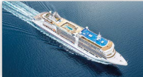
SILVER DAWN | 596 GÄSTE