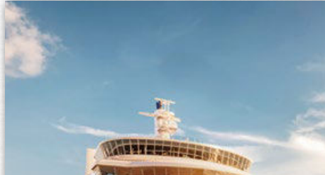
SILVER NOVA & SILVER RAY | 728 GÄSTE