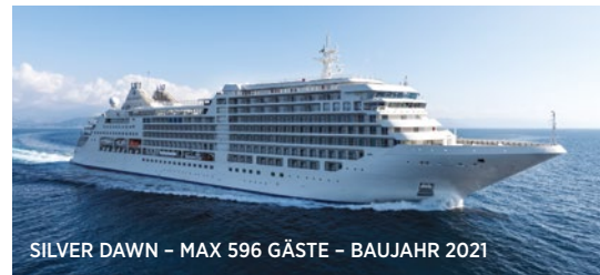
SILVER DAWN - MAX 596 GÄSTE - BAUJAHR 2021