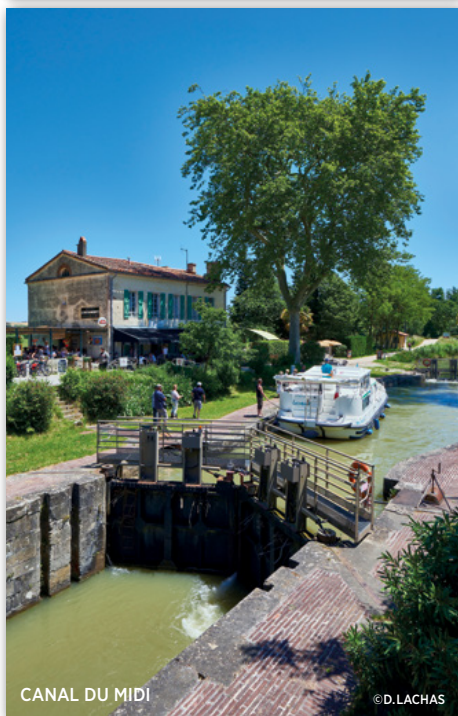
CANAL DU MIDI