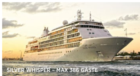
SILVER WHISPER – MAX 386 GÄSTE