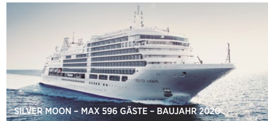
SILVER MOON - MAX 596 GÄSTE - BAUJAHR 2020